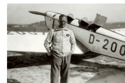
Hanns Klemm (1885 – 1961)