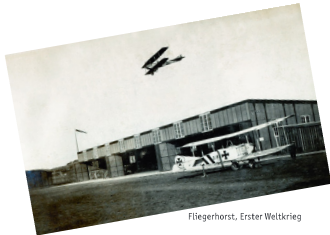
Fliegerhorst, Erster Weltkrieg