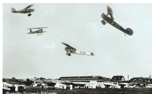
Fliegerhorst, Erster Weltkrieg